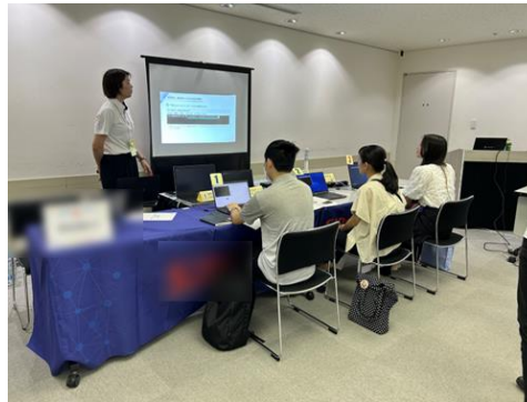
【参考】前回開催の様子