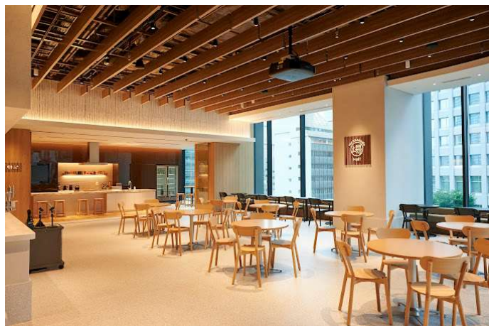
My Shokudo Hall & Kitchen