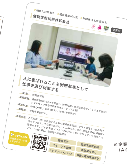
※企業情報イメージ (A4 サイズの 1/4)